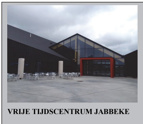
VRIJE TIJDSCENTRUM JABBEKE

Sommige afstanden gaan naar het nieuwe Vrijtijdscentrum te Jabbeke dat op zaterdag 25 augustus 2012, onder grote belangstelling, officieel geopend werd. Meer dan 2000 mensen volgden een rondleiding door het nieuwe complex dat jeugd, sport, cultuur- en bibliotheekfuncties in één gebouw integreert.