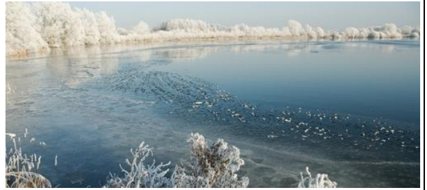
Domein "De Hoge Dijken" in winterstemming

Je kan er terecht voor warme hartverwarmende dranken, een frisse pint of frisdrank, vers gebakken pannenkoeken of een hongerstillende belegde boterham met soep.