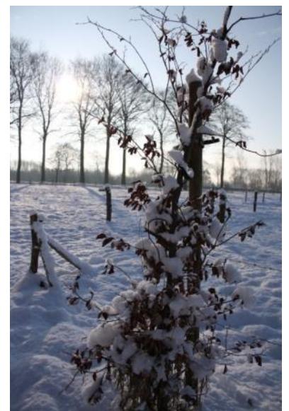
Winter in de Mascobossen